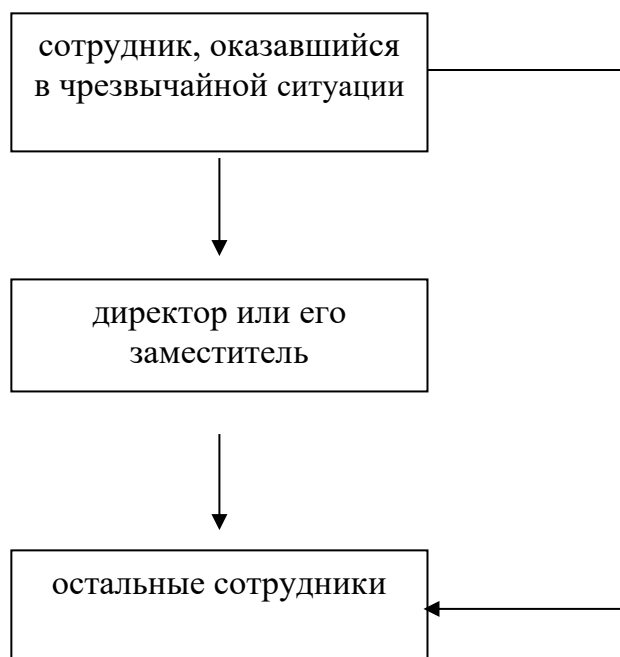
Схема движения информации и средство оповещения сотрудников в случае чрезвычайной ситуации:

Оповещение администрации и сотрудников о чрезвычайной ситуации осуществляется путем непосредственного устного сообщения , в случае отсутствия директора или его заместителя – путем сообщения им по мобильному телефону.